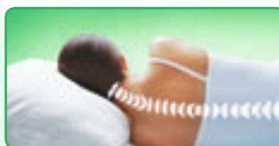
С ОБЫЧНОЙ ПОДУШКОЙ