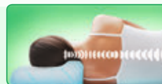
С ПОДУШКОЙ TRELAX®