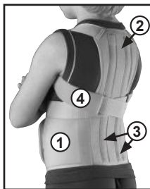
TLSO-250(P) рис. 2