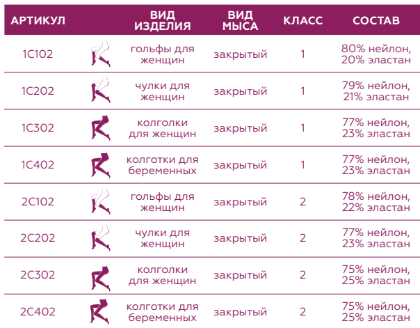
ТАБЛИЦА АРТИКУЛОВ И СОСТАВА ИЗДЕЛИЙ